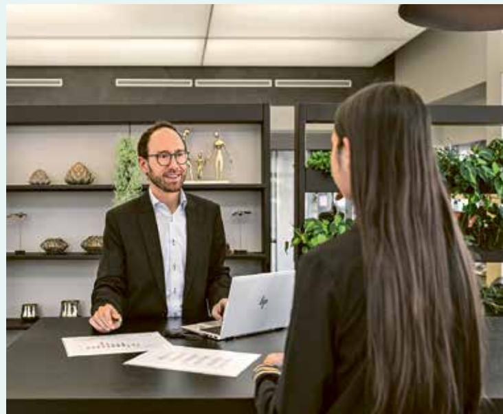
Beratung im Fokus: Umbauten in Gossau (oben) und St. Gallen (unten).