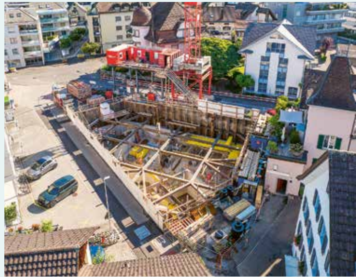
Neubau Niederlassung in Lachen.

Neuorganisation in St. Gallen. Die Beratung stand auch bei weiteren Anpassungen in St. Gallen im Fokus: Alle Beratungszimmer wurden im 3. Obergeschoss zusammengezogen und einladend gestaltet. Im 2. Obergeschoss haben neu die Teams Finanzieren und Private Banking ihre Arbeitsplätze. So sind die beiden Fachbereiche nicht mehr durch eine Etage getrennt. Diese Nähe fördert den Informationsfluss, stärkt die Kooperation und reduziert Schnittstellen. Das gilt auch für die Integration des Kundendienstes, die im gleichen Zuge erfolgte. Das Ziel der Umbau- und Zügelaktion konnte erreicht werden: acrevis lebt kein Silo-Denken, sondern pflegt ein konstruktives Miteinander, eine enge Zusammenarbeit mit kurzen Wegen und einem guten, direkten Austausch zwischen den Fachbereichen. Das bringt klare Vorteile für unsere Kundinnen und Kunden, denen wir so individuelle Lösungen mit einer kompetenten Rundumsicht auf ihre Finanzen anbieten können.