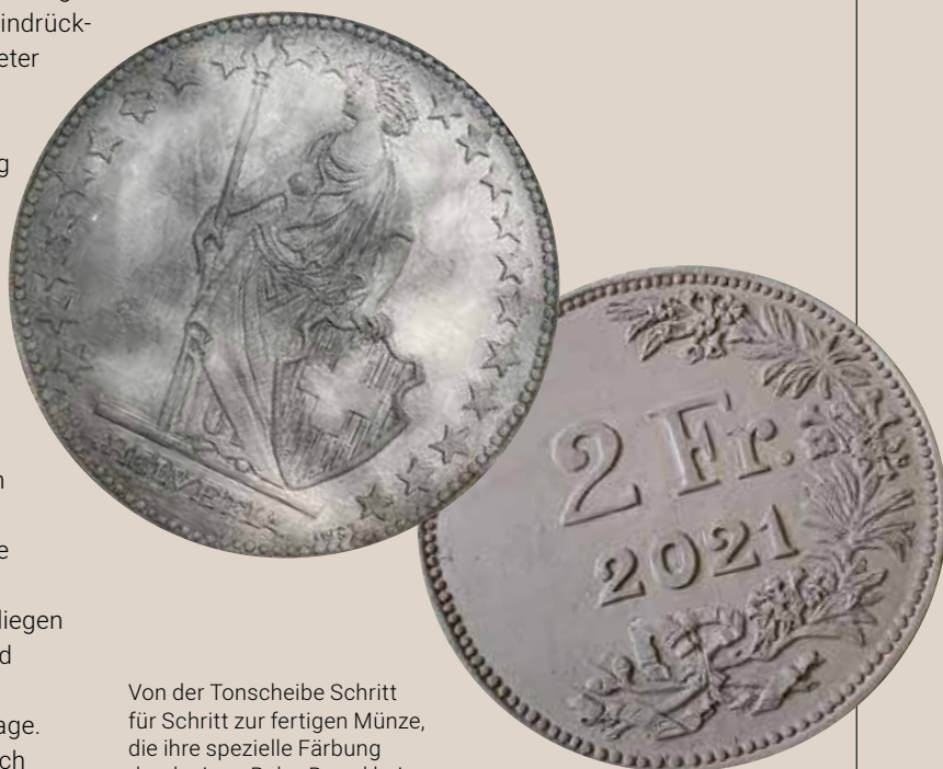
Von der Tonscheibe Schritt für Schritt zur fertigen Münze, die ihre spezielle Färbung durch einen Raku-Brand bei 1000 °C und das anschliessende Abräuchern erhält.